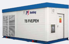
na pevný povrch